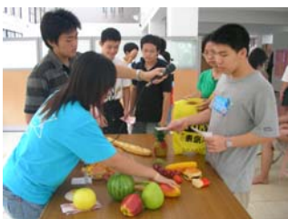
夏令營-社會適應課程演練

本會為依法設立，非以營利為目的之社會團體，以追求人類生而平等，維護並促進自閉症者及其家屬權益為宗旨。