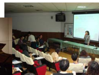
97 年校園宣導-鎮平國小