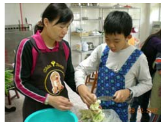
青少年生活技能成長班-食物烹煮