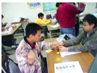
冬令營-學習作品縫製